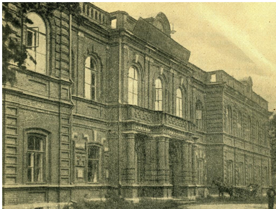
Главное здание Политехнического института имени М.Ф. Фрунзе

Свободных, больших корпусов для размещения учебных учреждений Института в одном-двух местах в Иваново-Вознесенске не было и организаторам пришлось налаживать учебные занятия в целом ряде (более дюжины) городских зданий, из которых некоторые как бывший дом Силантьева или бывшая Польская школа были до крайности тесны и все вообще разбросаны по всему городу.